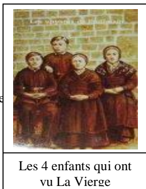
Les 4 enfants qui ont vu La Vierge