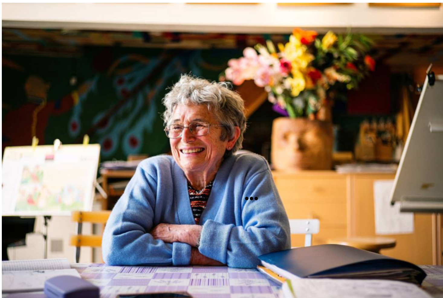
La dessinatrice s'est installée avec sa famille dans cette maison de Givraines il y a quarante-cinq ans.

Depuis son havre campagnard, elle envoie ses dessins chez les éditeurs. La créatrice fourmille d'idées. Elle lance ainsi la série Nicole au quinzième étage qui montre le monde vu du haut d'un immeuble, « parce que c'est ça que les enfants voient du monde ». Elle illustre aussi des imagiers sur les métiers signés d'une certaine Jacqueline Cohen, qui deviendra l'auteure de Tom-Tom et Nana . Elle participe surtout au lancement de Pomme d'api puis de